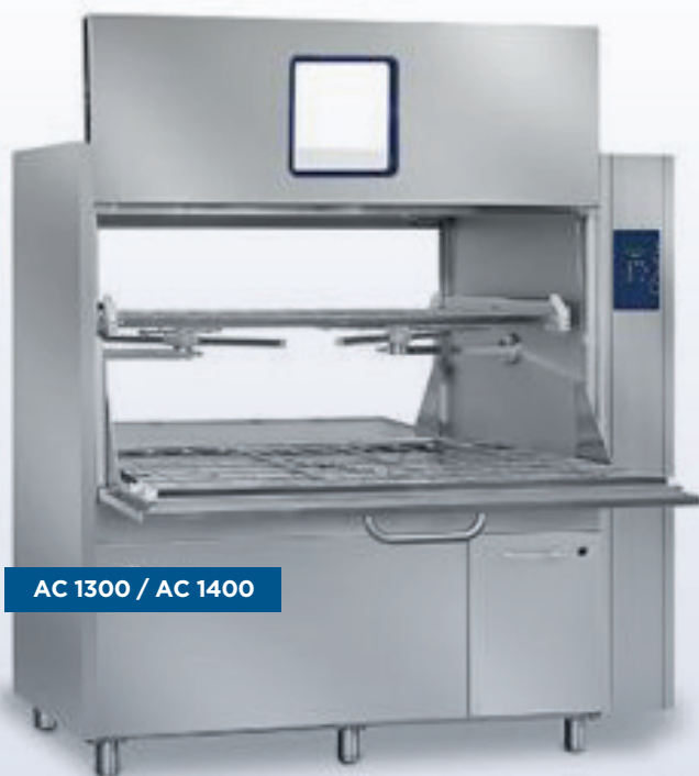
AC 1300 / AC 1400

W 1550 x D 900 x H 815 mm W 61.02" x D 35.43" x H 32.09"