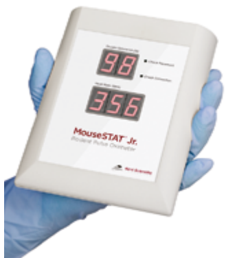
MouseSTAT® Jr. Ręczny pulsoksymetr dla myszy i szczurów Specjalna promocyjna cena: 4 770,00 zł