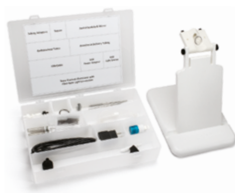
Zestawy do intubacji Już od 3 038,00 zł