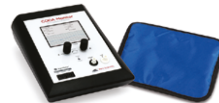
Monitor CODA 1 zwierzę