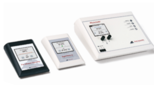
Systemy grzewcze FIT Warming Systemy do utrzymania temperatury ciała z matami na daleką podczerwień (FIR) Już od 1 688,00 zł