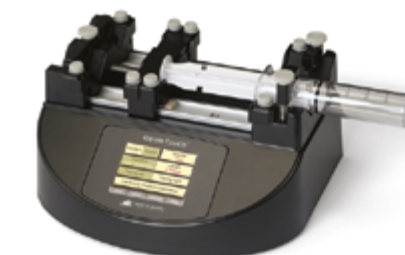
GenieTouch™ Pompa strzykawkowa z funkcją infuzji i aspiracji Specjalna promocyjna cena: 4 000,00 zł