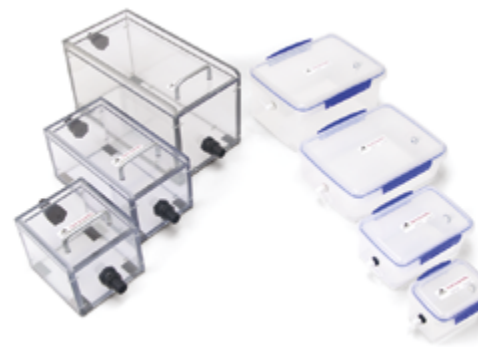
Komory indukcyjne Już od 428,00 zł