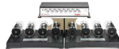
Systemy wielostanowiskowe CODA dla 2,4,6 lub 8 zwierząt (sieć, aż do 48 zwierząt)

System CODA dla 4 zwierząt Już od 35 708,00 zł*