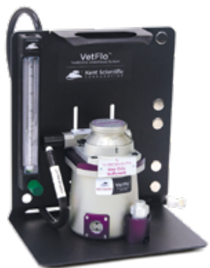
VetFlo™ Tradycyjny parownik Już od 13 388,00 zł